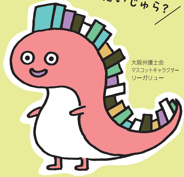
大阪弁護士会 マスコットキャラクター リーガリユ