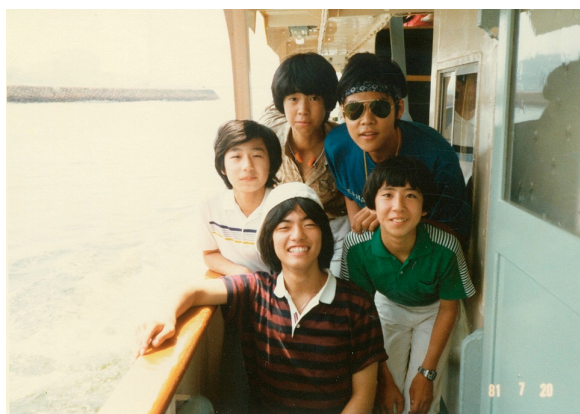
中学生時代。どれが僕でしょう!?

その後程なくして、父親は検察官を退官し、神戸で弁護士となり、それ以降今もずっと神戸に住んでいます。学校は、神戸市立高羽小学校を卒業後、私立甲南中学校に進学しました。