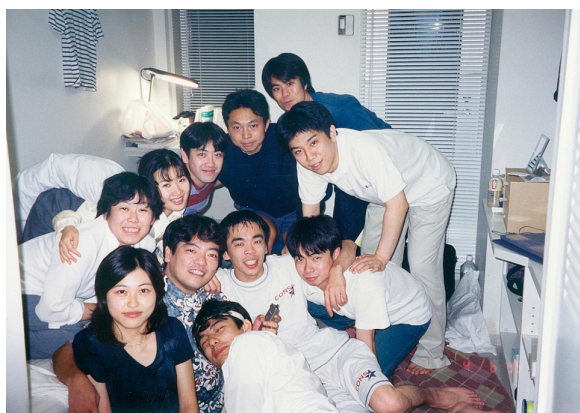
修習生時代「森バー」

修習した第53期は、初めて修習期間がそれまでの2年から1年半に短縮された期でした。そこで、研修所の生活も相当に詰め込み状態で、厳しいものでした。しかし、苦勞した末にやっと入所した研