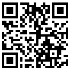
会場アクセスはこちら

ご参加を希望される方は、本書に参加者氏名を記入のうえ、該当項目にチェックを記入して担当委員宛にFAX 送信によりお申し込みください。【締切：令和5年1月16日（月）】